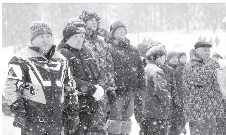
Погода в день гонок подвела. Но сильный снегопад никак не повлиял на количество зрителей