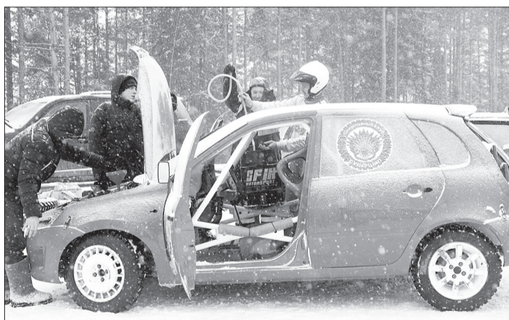
Чтобы подготовить гоночный автомобиль к очередному заезду, требуется команда профессионалов