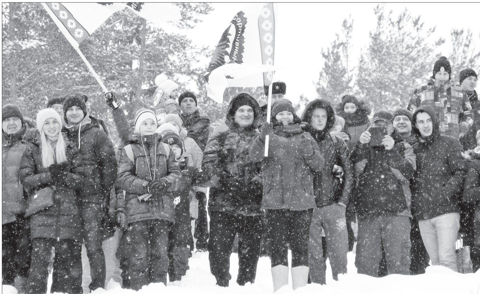
Азарт гонок, буря эмоций и особая энергетика соревнований не давали зрителям замёрзнуть